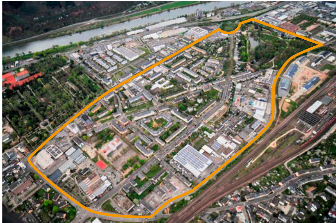
Bearbeitetes Luftbild „Portaflug“